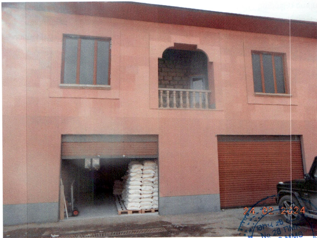
Ն կ. 1 Ավտոտնակի ներկայիս տեսքը

Կոնստրուկտիվ համակարգը լուծված է երկայնական ու լայնական պատերով և միջհարկային ծածկերով: