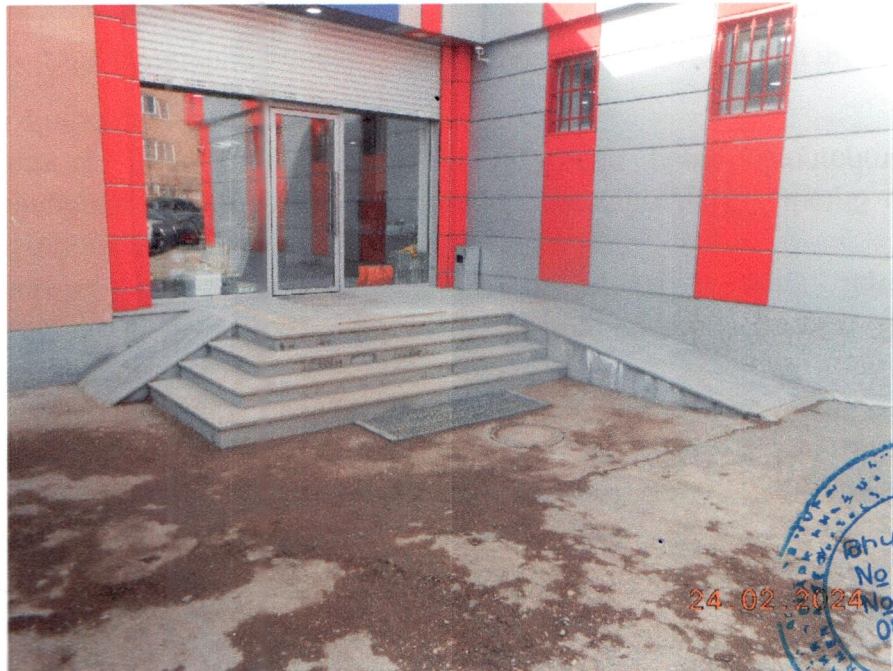
Նկ.3 Արտաքին աստիճան- հարթակ-թեքահարթակներ-համակարգի տեսքը

-Կառույցի գլխավոր ճակատի աջ հատվածամասին կիպ հարևանությամբ գտնվող խանութի շենքի ընդլայնված հատվածամասին կից իրականացվել է արտաքին աստիճան – հարթակ – թեքահարթակներ համակարգ ,որը տեղակայված է դիտարկվող հողակտորում (Նկ3):