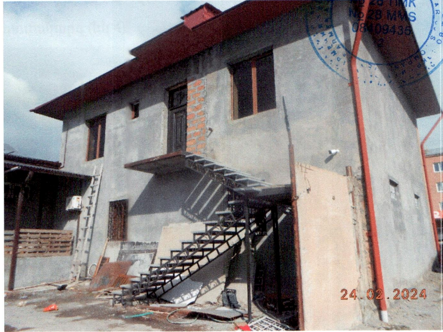
Նկ.2 Արտաքին աստիճանային համակարգի տեսքը

-Կառույցի երկրորդ հարկի ֆունկցիոնալ կապն ապահովելու համար, բակային ճակատից իրագործվել է պողպատե տարրերից սանդղաբազուկներով և միաձուլված երկաթետոնե հարթակով արտաքին աստիճանային համակարգ (Նկ2) :