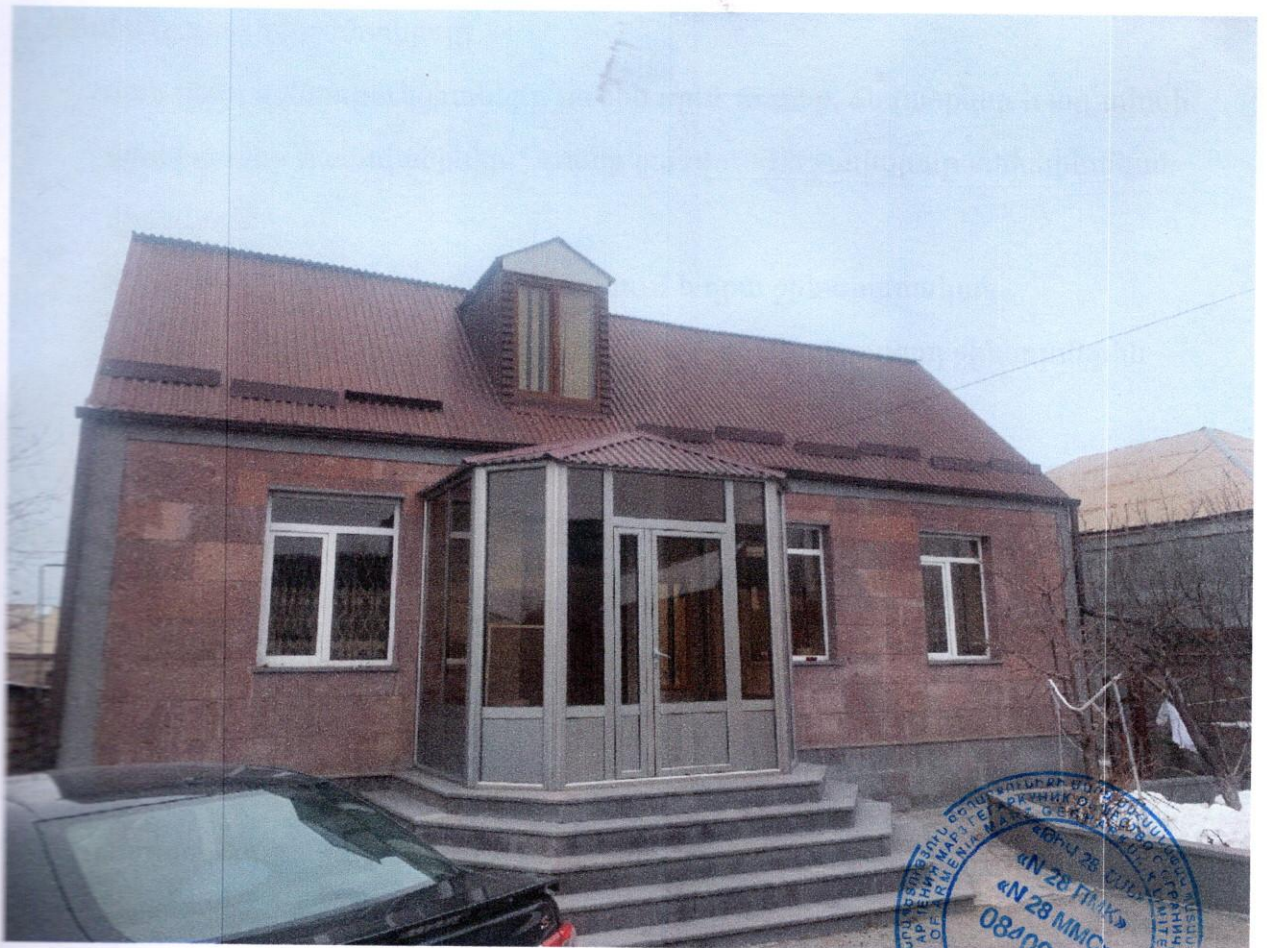
Նկ.1 Բնակելի տան տեսքը

Տան կոնստրուկտիվ համակարգը լուծված է երեք երկայնական կրող և լայնական պատերով, միջհարկային ծածկով ու վերնածածկով: