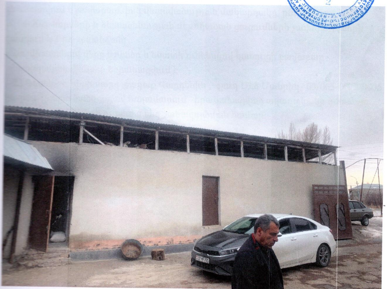
Նկ.3 Ավտոտնակի տեսքը