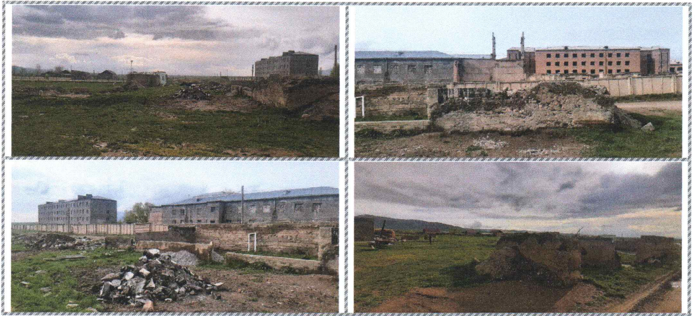
ՀՀ, Ղեղարքունիքի մարզ, Վարդենիս համայնք, գյուղ Սոթք, 3-րդ փողոց, թիվ 16/1 հասցեում գտնվող, 719.2 քմ մակերես զբաղեցնող բնակավայրերի նշանակության հողամաս:

A handwritten signature in blue ink, consisting of stylized, overlapping loops and lines.