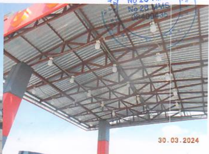
Նկ.2 Ծածկի տեսքը