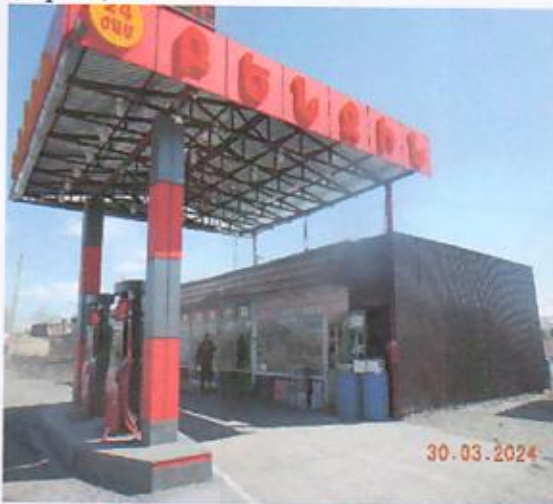
Նկ.1 Բենզոլցման կետի տեսքը

Բենզոլցման կետը և ծածկը հարթ տեղանքի վրա 2018 թվականին իրականացված, սպասարկման գործառնական նշանակության համալիր կառույց է (նկ.1,2):